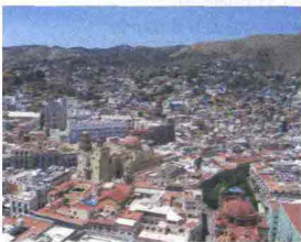
Foto senza speranza, pugni nello stomaco di noi lettori. La vita.